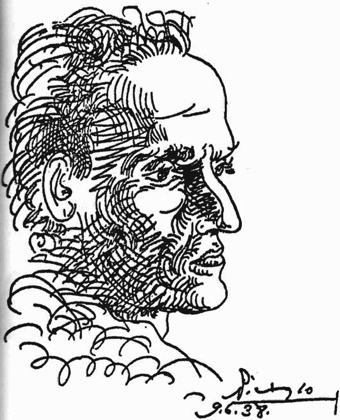
César Vallejo, por Picasso.