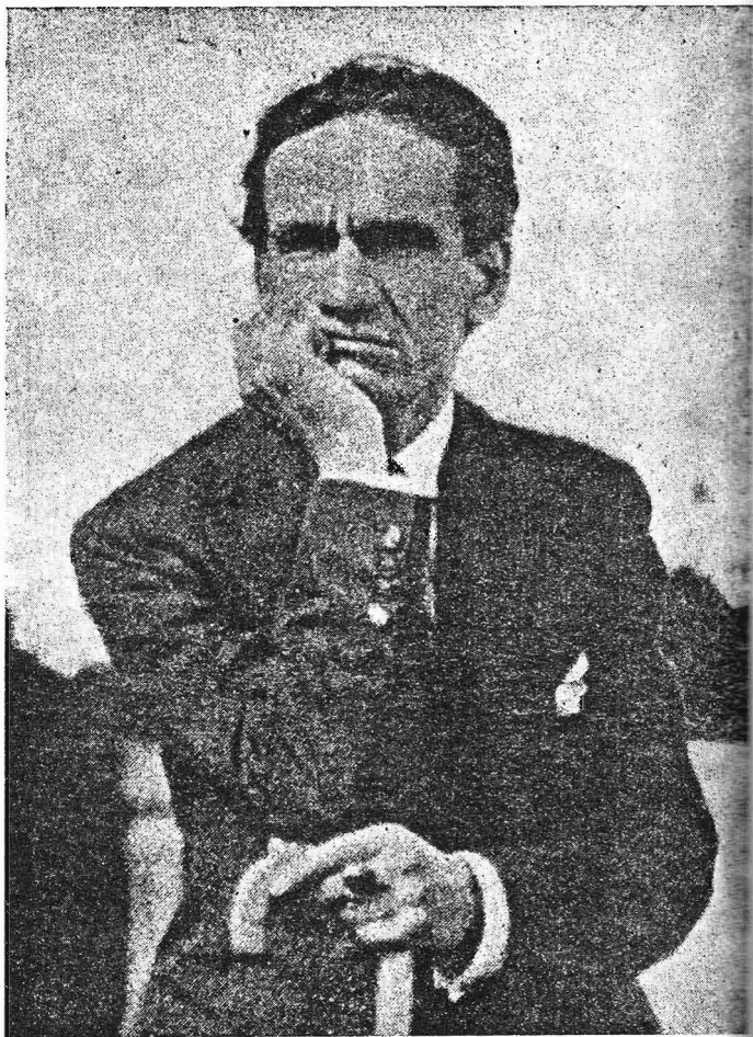
Fotografía de César Vallejo, poco antes de morir.