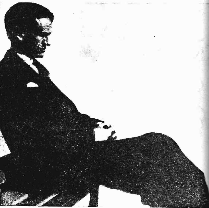
Fotografía de César Vallejo en los últimos días de su vida.